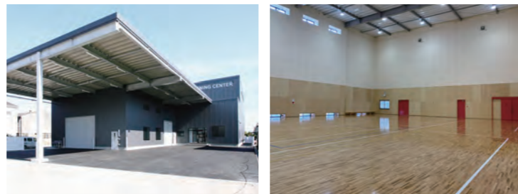
選手専用の練習施設で思いのまま練習することができ、選手育成の大事な要素になっている。

倉敷アブレイズ専用「トレーニングセンター」 専用コートとトレーニングジムを備え 選手の育成をバックアップ。