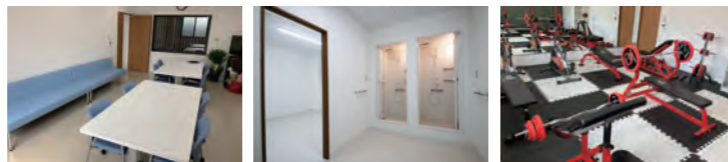
トレーニングジムやシャワー室など選手は負担なく練習ができる環境が整っている。